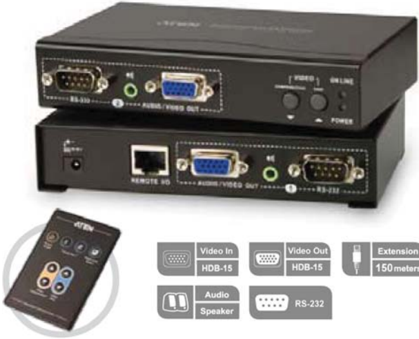
ATEN-VE200 Ses/ VGA Görüntü Sinyali Uzatma Cihazı Hoparlör bağlantı desteği, 150 metre